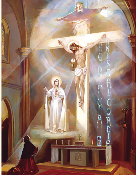
Vision de sœur Lucie, à Tuy, en 1929 :

„Très Sainte Trinité, Père, Fils et Saint-Esprit, je vous adore profondément et je vous offre les très précieux Corps, Sang, Âme et Divinité de Notre Seigneur Jésus-Christ, présents dans tous les tabernacles du monde, en réparation des outrages, sacrilèges et indifférences par lesquels il est Lui-même offensé. Par les mérites infinis de son Cœur Sacré et par ceux du Cœur Immaculé de Marie, je vous demande la conversion des pauvres pécheurs“.