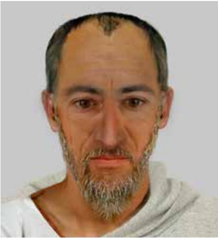
DER HEILIGE. PAULUS.

beugende Pädagogik Gottes lichtvoll sichtbar. Sehen wir uns dazu ein berühmtes Beispiel an: Saulus wird auf dem Weg nach Damaskus durch ein himmlisches Licht vom Pferd geworfen und erblindet – ein direkter Eingriff Gottes. Das Augenlicht gewinnt er aber wieder, nicht durch einen entsprechenden gött-