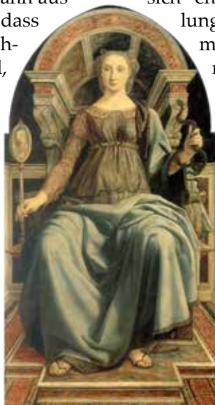
ALLEGORIE DER KLUGHEIT

wirtschaftliche Existenz zu sichern, die Kinder zu christlichen Persönlichkeiten heranzubilden oder einfach gesagt: Er hat seinen Mann zu stehen.