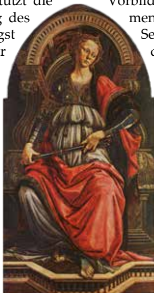
ALLEGORIE DES STARKMUTS

Starkmut ist jene Tugend, welche auch Seelenstärke, Charakterstärke oder christliche Mannhaftigkeit genannt wird. 2 Sie unterstützt die Seele in der Verfolgung des Zieles und hilft, die Angst zu überwinden. Es war diese Tugend, wenn auch nicht immer in ihrer reinen Form, welche die großen Kulturen erschuf, die vielen Entdeckungen ermöglichte, die Feinde des Friedens und der Freiheit abwehrte, die Christianisierung des größten Teiles der Welt entstehen ließ. Wie schildert doch der hl. Paulus so eindrücklich „In vielerlei Mühsal, in häufigen Kerkerstrafen, in Mishandlungen über die Maßen und oftmals in Todesgefahren“ 3 und