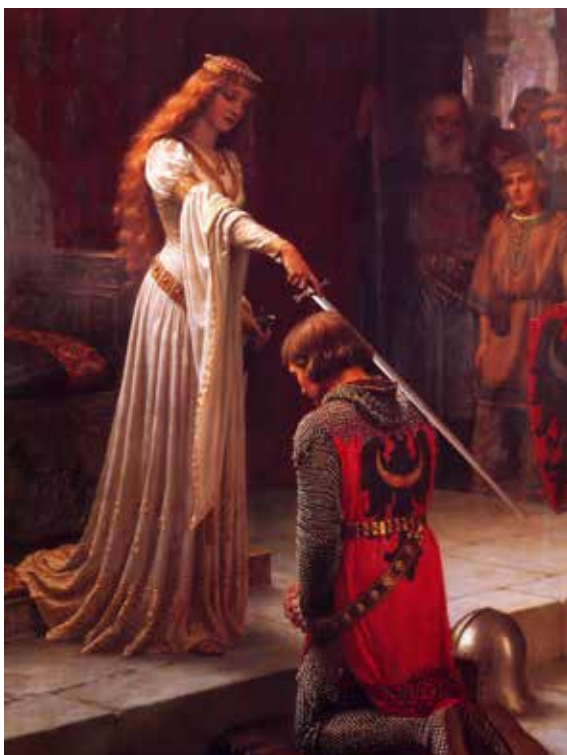
DER RITTERSCHLAG VON EDMUND LEIGHTON

„Ein Werkzeug sein, das dir dient, um so viel als möglich deine Ehre zu vermehren.“ So betet der Ritter der Immaculata im Weiheakt. Ein Werkzeug ist umso nützlicher, je mehr es für das angestrebte Ziel taugt. In Bezug auf das Ziel des Menschen im Allgemeinen und spe-