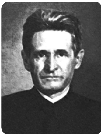
PATER RUPERT MAYER

Maria formt ihre Kinder. Wenn wir werden wollen, was wir sein sollen, dann müssen wir uns von ihr formen lassen. Es ist eine wichtige Erkenntnis, dass unsere himmlische Mutter gerade dafür da ist, dass wir umgeformt werden in die Vollgestalt Christi. Gott wollte ja, dass sie durch und wegen der Mutterschaft für seinen Sohn auch uns und allen seinen Kindern Mutter sei.