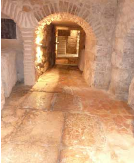
DER LITHOSTROTOS (STEINPFLASTER) UNTER DEM KLOSTER DER SIONSSCHWESTERN WIRD ALS ORT DER GEISSELUNG VEREHRT.

Abtötung des Leibes. Warum muss sich der Christ abtöten?