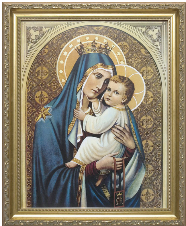
Die Muttergottes mit dem Jesuskind und dem Braunen Skapulier