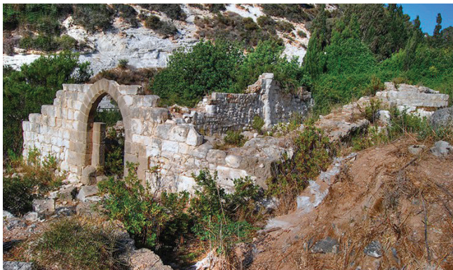
Überreste der ersten Kapelle auf dem Berge Karmel

uns, dass Elias auf einem feurigen Wagen in den Himmel entrückt wurde und dabei seinen Mantel zurückließ. Dann nahm Elisäus den von Elias hinterlassenen Mantel auf (Könige 2,13). Im 12. Jahrhundert ließen sich Kreuzritter und Pilger auf dem Karmelberg nieder, um im Gedenken an den hl. Elias und zur Ehre der Muttergottes dort ein Leben des Gebetes und der Buße zu führen. Daraus entstand der Karmelorden.