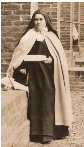
Die bl. Theresia von Lisieux, eine Karmelitin (gestorben 1897), trug das ganze Braune Skapulier vom Berge Karmel.

Im Mai 1957 veröffentlichte ein Karmeliterpriester in Deutschland die ungewöhnliche Geschichte, wie das Skapulier ein Haus vor dem Feuer rettete. In Westboden (Deutschland) war eine ganze Reihe von Häusern in Brand geraten. Als die frommen Bewohner eines Hauses in der Mitte dieser Reihe das Feuer sahen, befestigten sie sofort ein Skapulier an der Haustüre. Funken flogen über und um das Haus herum, aber das Haus blieb unversehrt. Innerhalb von fünf Stunden waren 22 Häuser in Asche verwandelt worden. Das einzige Bauwerk, das unbeschädigt inmitten der Zerstörung stand, war das, an dessen Tür das Skapulier befestigt war. Hunderte von Menschen, die kamen, um den Ort zu sehen, der durch die Gottesmutter gerettet wurde, sind Augen-