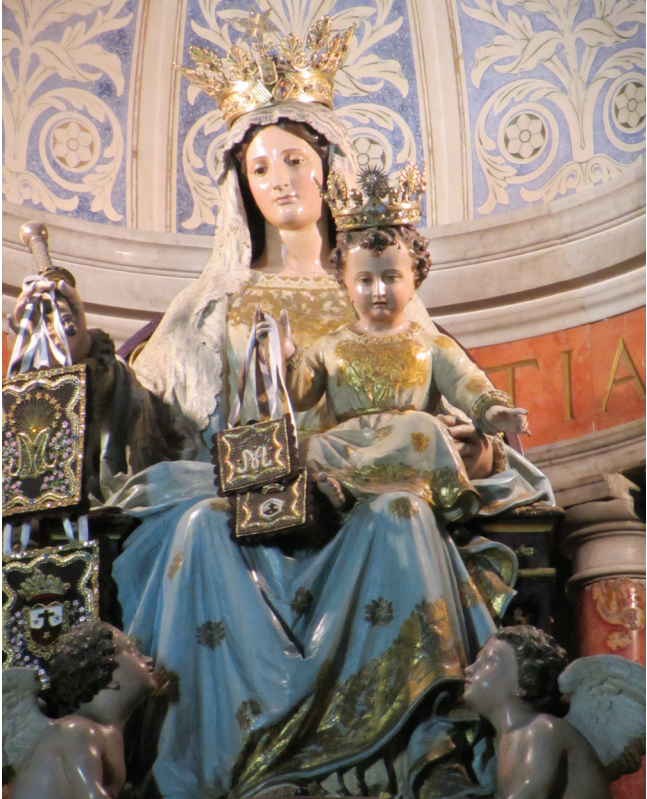
Statue Unserer Lieben Frau vom Berge Karmel im Karmelitenkloster Stella Maris im Karmelgebirge bei Haifa (Israel)